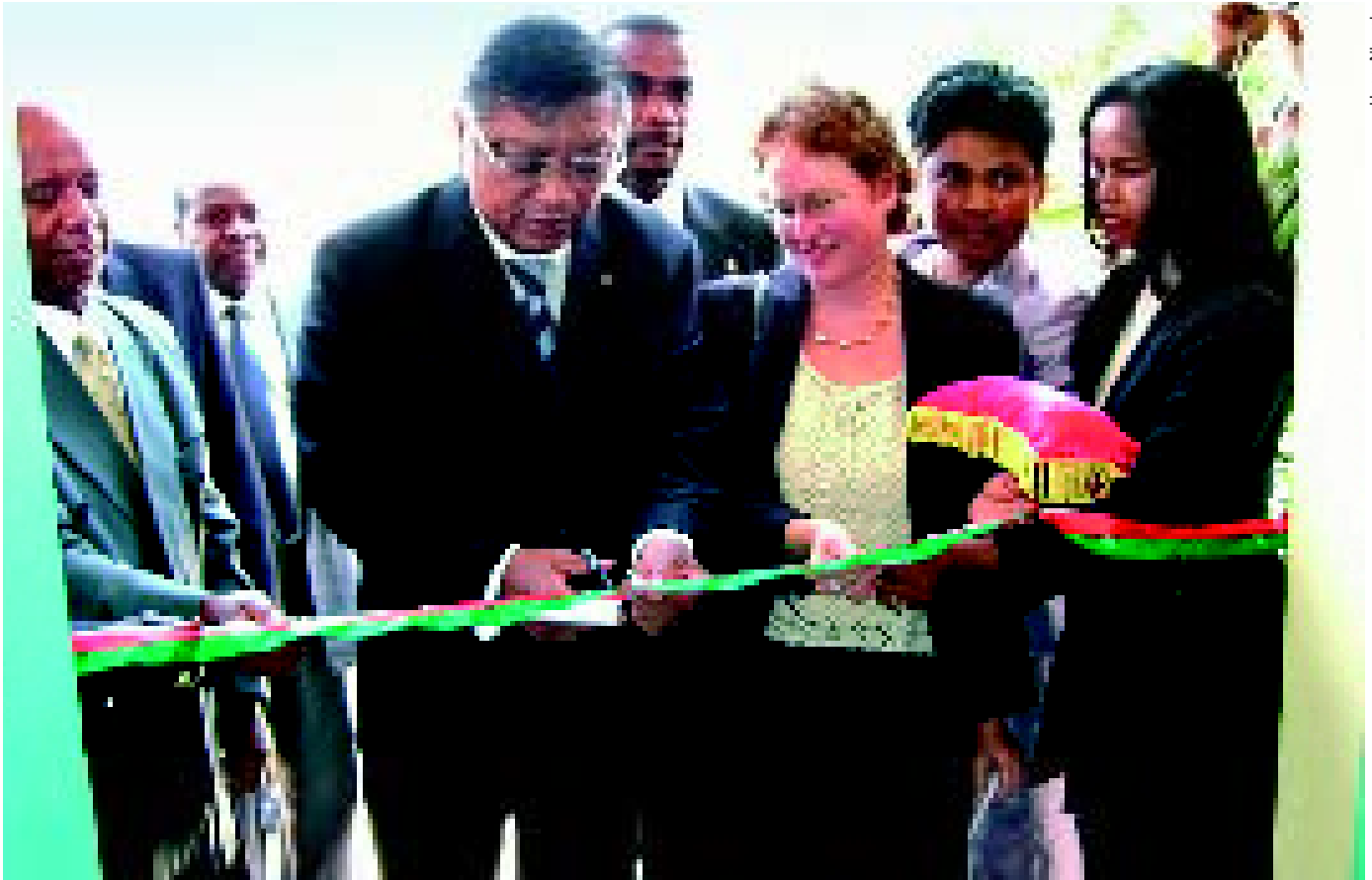
El Ministro de Salud inaugura el Centro Nacional para Refracción y Entrenamiento para Visión Baja en el Día Mundial de la Visión, 11 de octubre del 2007. MADAGASCAR