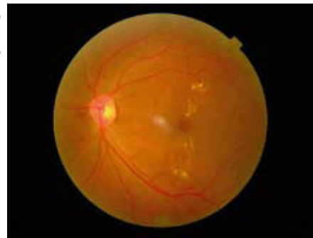
Edema macular clínicamente significativo con exudado duro penetrando en la fóvea identificado en un despistaje fotográfico en un paciente asintomático.

de subespecialidades tal como ésta. De muchas maneras, los requisitos de equipos son menos: una cámara y alguien que realice el entrenamiento. En la medida que la carga de retinopatía diabética crece, las clínicas extra-muros de despistaje utilizando una cámara portátil podrán tanto aumentar la eficiencia de la asistencia oftálmica como disminuir la pérdida de visión por causa de la diabetes.