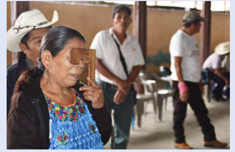
Toma de agudeza visual al interior de Guatemala.